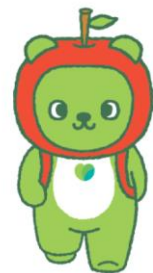
長野県PRキャラクター『アルクマ』 ©長野県アルクマ