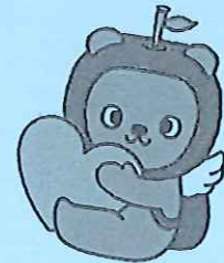
長野県PRキャラクター「ママ」