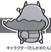
キャラクター「たしかめたん」