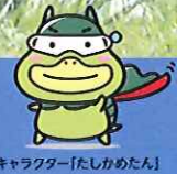
キャラクター「たしかめたん」