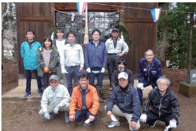
(諏訪神社にて行われたボンポリ事業集合写真)