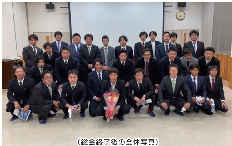
(総会終了後の全体写真)