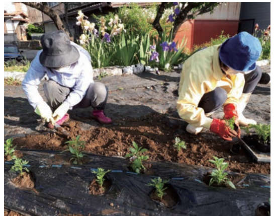
(ペゴニア、サルビア等のお花を植えました)

※県連では、5月に通常総会・主張発表大会を開催しました。主張発表大会の東信地区代表に長和町商工会の発表者が選ばれ、その後の県大会へ進出。各地域から選ばれた発表者が県大会に参加し、各自の主張発表を行ないました。その中で最優秀賞に選ばれた南信地区代表の富士見町商工会さんが、長野県の代表として7月の関東ブロック大会(山梨県)に出場されました。全国大会(宮城県)の主張発表大会は、10月に開催される予定です。