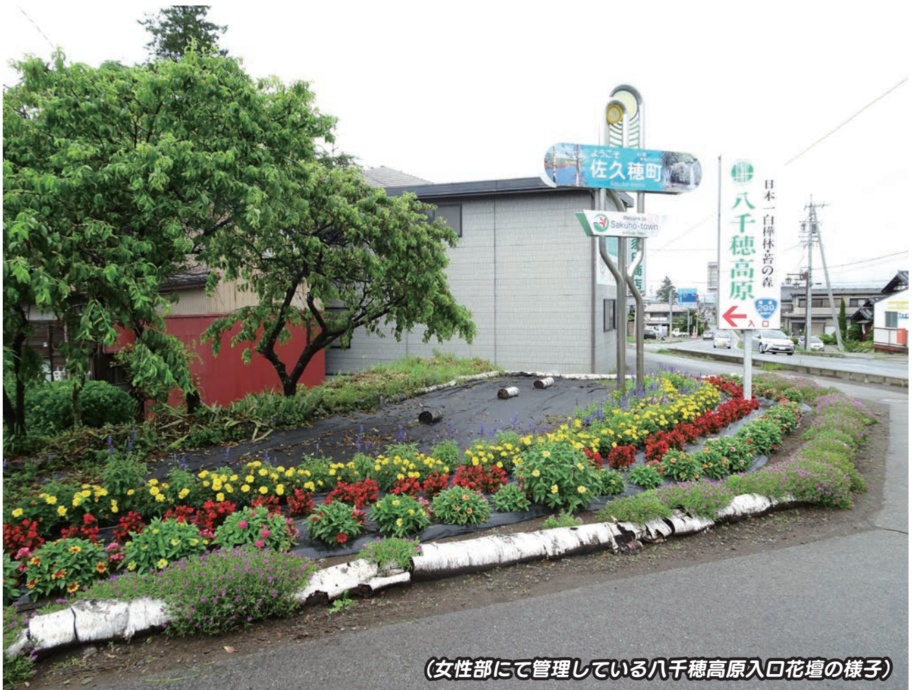
(女性部にて管理している八千穂高原入口花壇の様子)