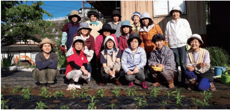
(花植え作業終了後の集合写真)