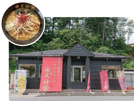
(店舗外観と味噌ラーメン)

メニューは、醤油、味噌ラーメン、つけ麺、担々麺、小学生以下限定のお子様ラーメン、アルコール類、おつまみに定番のチャーシューや辛味ネギ、鶏の唐揚げ、だし巻き玉子等幅広く取り扱っております。お酒とおつまみのみのお客様も大歓迎です。小上がり席もありますので小さいお子様連れのご家族にも最適です。簡単ではございますがお店の紹介をさせて頂きました。開業したばかりの若輩者で至らぬ点もあるかと思いますが、御指導ご鞭撻の程、宜しくお願いいたします。